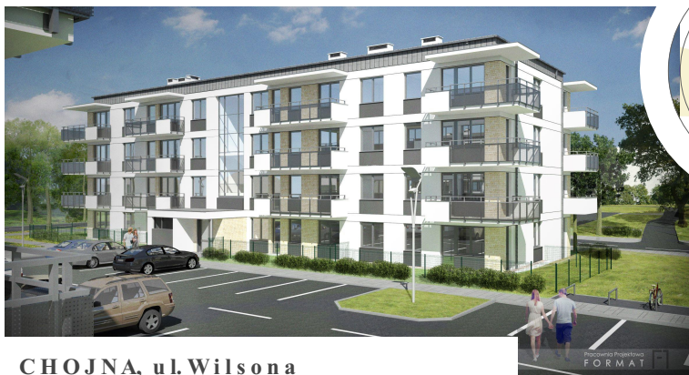
CHOJNA, ul. Wilsona