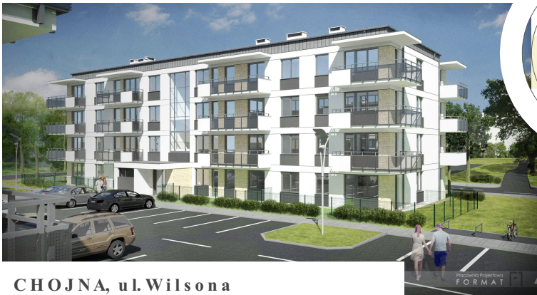
CHOJNA, ul. Wilsona